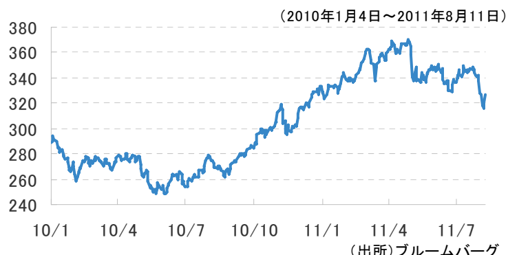
【図表2】 CRB商品指数の推移