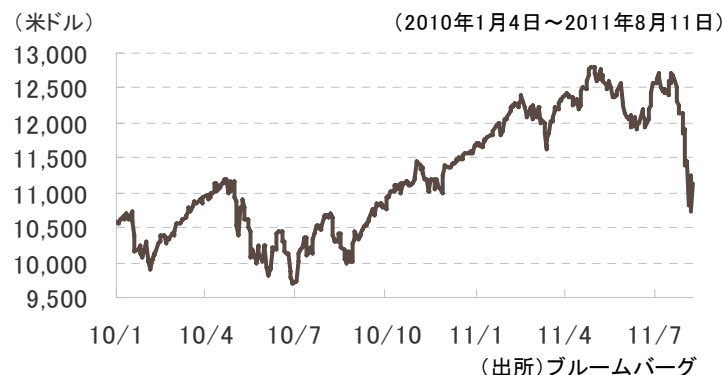
【図表3】 NYダウ株価指数の推移