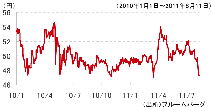
【図表1】 ブラジル・レアル為替レートの推移(対円)