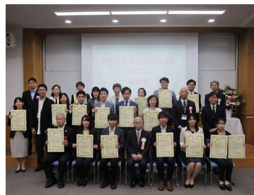
優秀賞に選出された団体・企業