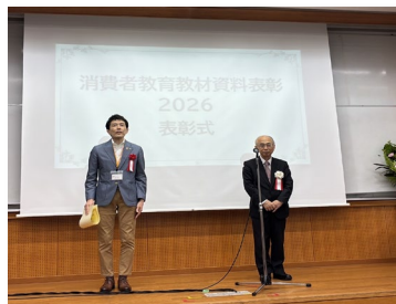
長野センター長（左）と田口理事長（右）