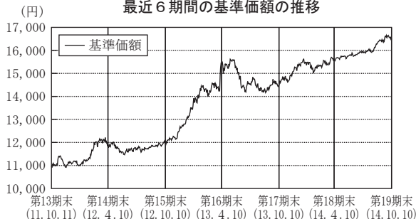
最近6期間の基準価額の推移