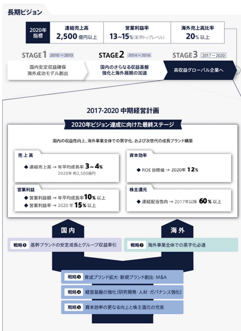
図表2 新中期経営計画

本年2月に新中期経営計画（図表2）を発表しています。2020年を最終年度とし、連結売上高2,500億円以上、営業利益率13-15%（業界トップレベル）、ROE12%などが示されました。また、海外売上比率20%以上という目標も示され、高収益グローバル企業への定量的な道筋がより提示されたことで、同社の成長の期待値は高まっています。