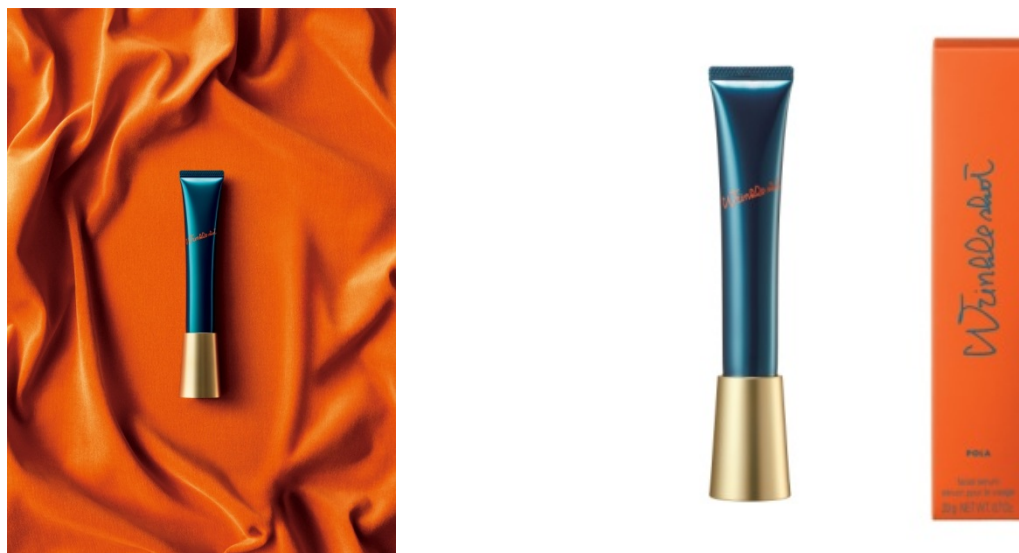
図表1 リンクルショット メディカル セラム

なお、資生堂が2017年2月28日に「有効成分レチノールによるしわを改善する効能効果の承認を日本で初めて取得」というリリースを発表しています。潜在的には、ポーラの新製品の競合となる可能性もゼロではありませんが、①スキンケアに特化したポーラの研究開発における優位性、②ビューティーディレクターによるカウンセリングなど販売面での強み、そして、③市場で初めて商品を投入したことによる先行者メリットなどの観点から、ポーラの新製品の競争優位性が大きく揺らぐ可能性は低いと考えます。