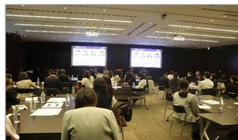
▲パネルディスカッションの様子

第二部のグループディスカッションでは、対面参加者が「育児との両立」「介護との両立」「部下のキャリア育成支援」「自分らしいキャリア」の4つのグループに分かれ、各テーマについてディスカッションを行いました。参加者からは、「同業他社の方々と年齢・部署を超え、悩みを共有できたのは大変貴重な経験でした。」「参加者の皆さまが前向きで、他社好事例なども伺い大変参考になりました。」「といった感想が挙がりました。