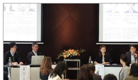
▲パネルディスカッション登壇者