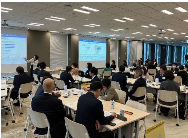
第一部 アンケート結果共有の様子

参加者：資産運用業界の経営層 合計35名、会場：アセットマネジメント One 株式会社