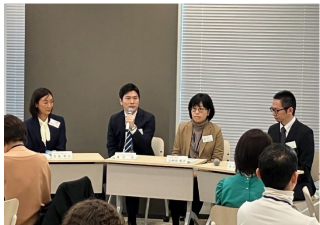
第二部 パネルディスカッションの様子