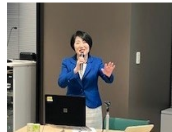
片倉氏による講演

・Involve 社「Heroes Women Role Model List」日本初の殿堂入り