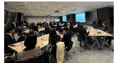
グループディスカッションの様子

第二部では、講演内容を受けた気づきや、職場に戻って実践したいことを中心に、参加者同士で話し合ってもらいました。参加者からは、「普段接点のない職種・属性の人と話すことが出来て有意義だった」という声が寄せられた一方、課題として、経営層における意識づけや女性の採用の難しさなども挙げられました。