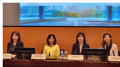
パネルディスカッション登壇者

パネリストとして業界の第一線で活躍する女性リーダーたちが登壇し、「臆せずチャレンジすることが大事」「他の方と比べない、一歩でも半歩でもいいから進む。」など、自身のキャリア形成や転換期での前向きな姿勢を伺うことができました。参加者からは「ロールモデルではなく『ロールパーツ』という考え方を初めて知り、重要な考え方だと思った。」「キャリアを積んでいる人はみな、チャレンジしたからこそその結果だと分かった。」といった声をいただくなど、大盛況のうちに終わりました。今回の参加者は男性が3割を超えており、年齢層も幅広く、業界全体における女性活躍推進への関心の高さを再認識しました。(次頁の参加者アンケート参照)