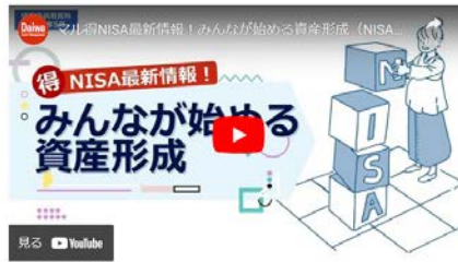
当動画はNISA運用による資産形成の解説やノウハウをご紹介しています。

新しいNISA制度について理解を深めていただくために、お役立ちコンテンツをご用意しています。