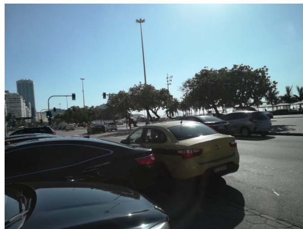
▲写真の黄色い車はタクシーですが、Uber ではごく普通の乗用車が配車されます