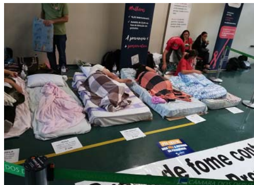
▲国会議事堂の通路でのパフォーマンス